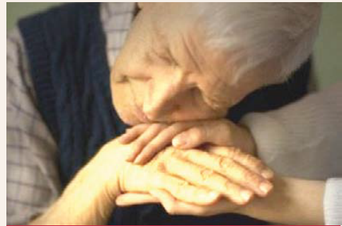
yaradılanı severiz yaradandan ötürü

Daha ayrıntılı bilgi için 24 saat yanınızdayız. Bizi arayın! sizi evinizde ziyaret edelim