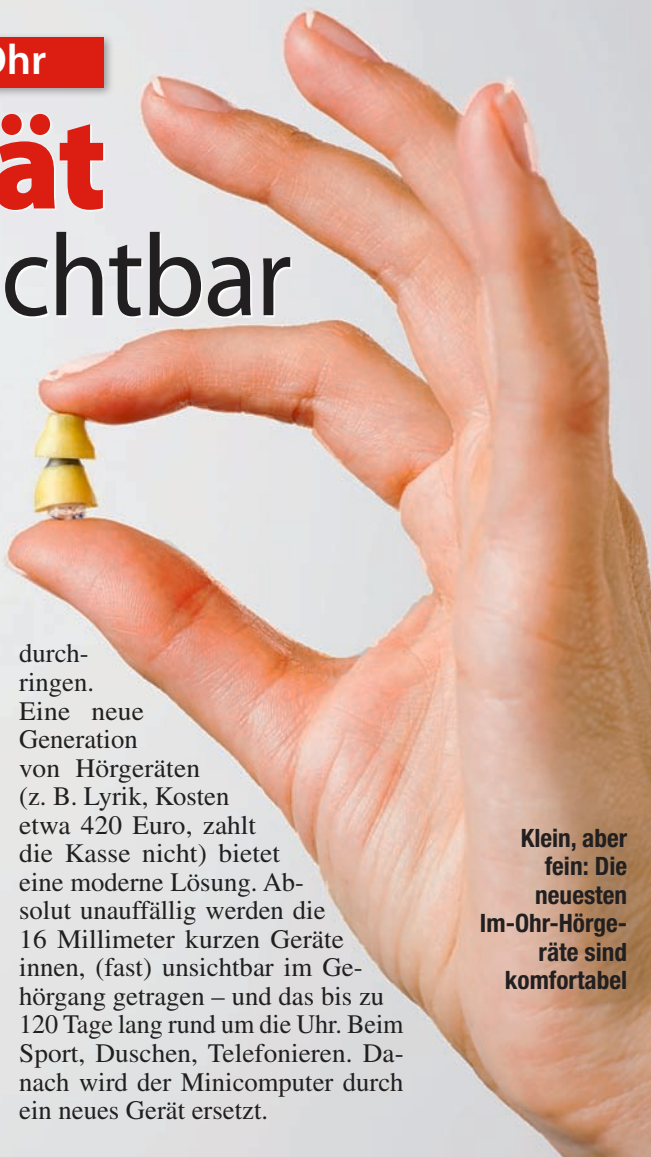
Klein, aber fein: Die neuesten Im-Ohr-Hörgeräte sind komfortabel

durch-ringen. Eine neue Generation von Hörgeräten (z. B. Lyrik, Kosten etwa 420 Euro, zahlt die Kasse nicht) bietet eine moderne Lösung. Absolut unauffällig werden die 16 Millimeter kurzen Geräte innen, (fast) unsichtbar im Gehörgang getragen – und das bis zu 120 Tage lang rund um die Uhr. Beim Sport, Duschen, Telefonieren. Danach wird der Minicomputer durch ein neues Gerät ersetzt.